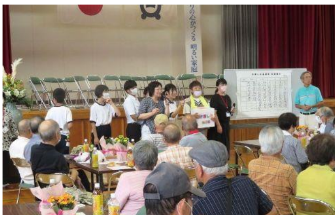
☆抽選会風景(瀬部校区)