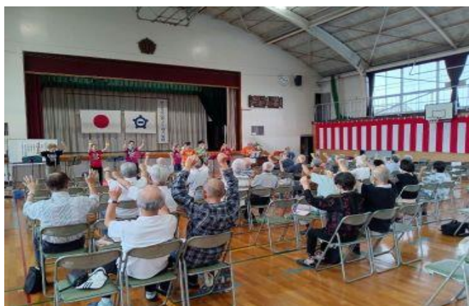
☆みんなで手挙げ「結んで開いて」 (赤見校区)