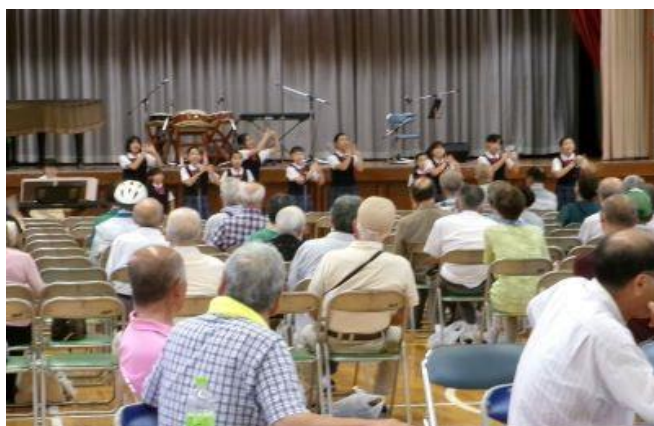
☆きそがわKIDS合唱(浅野校区)