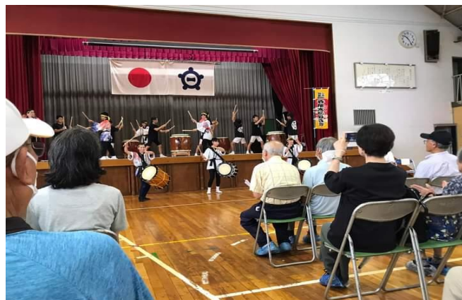
☆春明太鼓を楽しむ(西成校区)